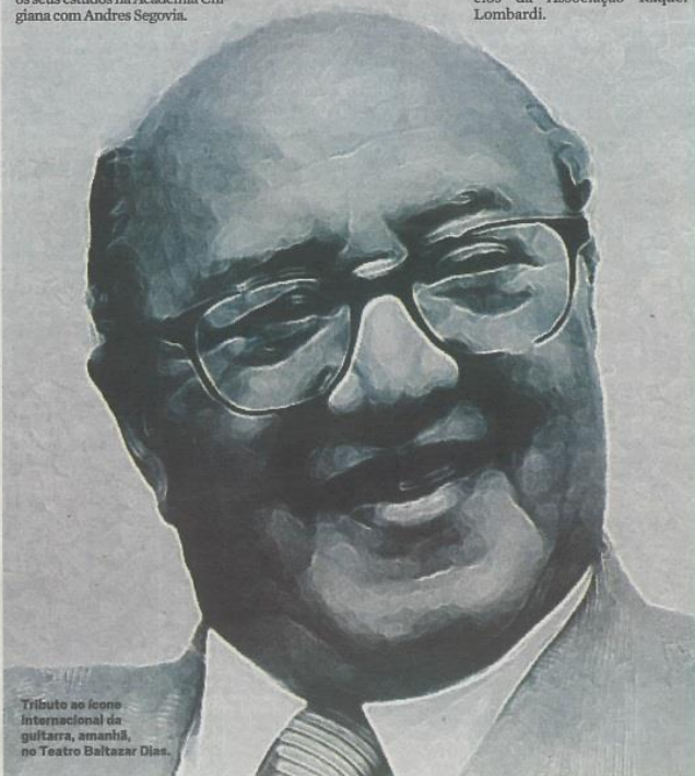
Tributo ao ícone internacional da guitarra, amanhã, no Teatro Baltazar Dias.

Este espectáculo é uma parceria da Câmara Municipal do Funchal com a Associação Raquel Lombardi e a receita reverte a favor de uma doente oncológica e de uma criança com uma doença rara. A entrada terá um custo de 10 euros (venda antecipada), 20 euros no dia do concerto e 5 euros para Sócios da Associação Raquel Lombardi.