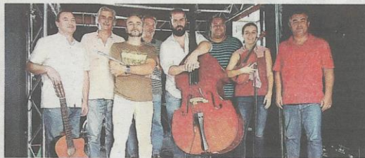
O MEOATLÂNTICO é composto por oito músicos.

Refira-se ainda que os ingressos para o concerto do dia 23 de Novembro no Teatro Municipal têm um custo unitário de 5 euros.